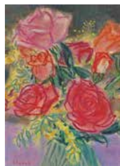
「ミモザと薔薇」F4 パステル