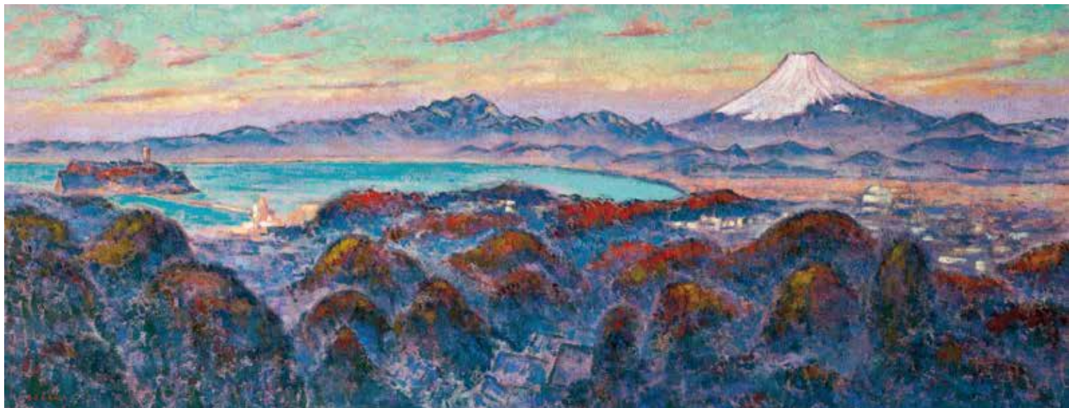
「朝陽富士(鎌倉山)」油彩 1167×450mm